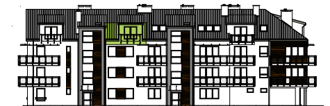
Elevacja wejściowa - północna