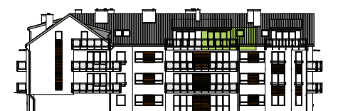
Elevacja tylna - północna