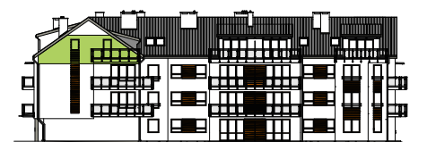
Elewacja tylna - południowa