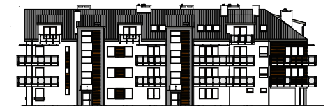
Elewacja wejściowa - północna