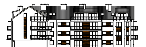
Elewacja tylna - południowa