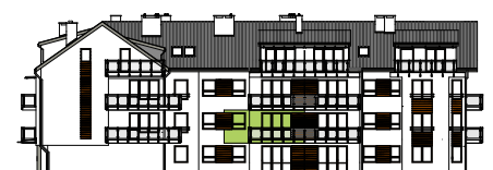
Elewacja tylna - południowa