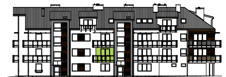
Elewacja wejściowa - północna