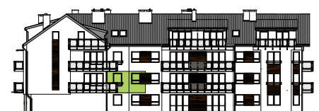
Elewacja tylna - południowa