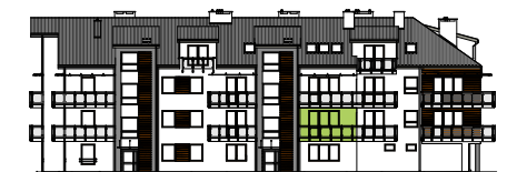
Elewacja wejściowa - północna