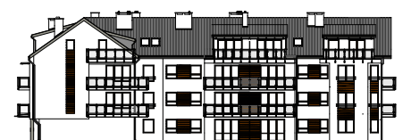
Elewacja tylna - południowa