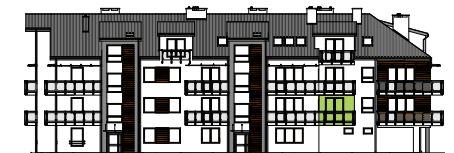
Elewacja wejściowa - północna