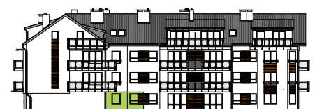
Elewacja tylna - południowa