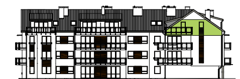
Elewacja tylna - wschodnia