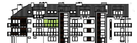
Elewacja wejściowa - zachodnia