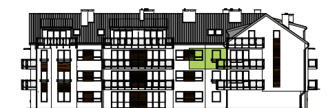
Elewacja tylna - wschodnia