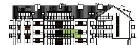
Elewacja tylna - wschodnia