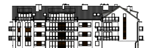
Elewacja tylna - wschodnia