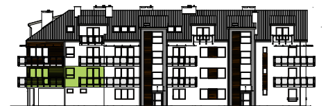
Elewacja wejściowa - zachodnia