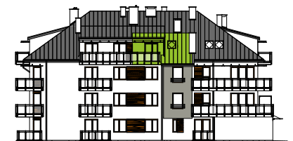
Elewacja tylna - wschodnia