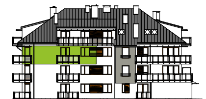
Elewacja tylna - wschodnia