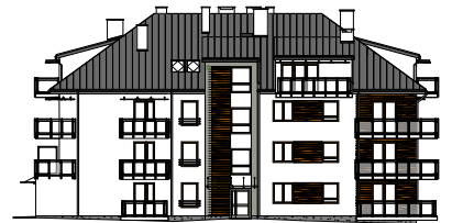
Elewacja wejściowa - zachodnia