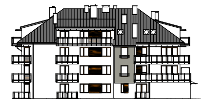
Elewacja tylna - wschodnia