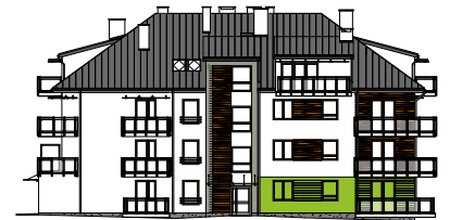
Elewacja wejściowa - zachodnia