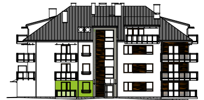
Elewacja wejściowa - zachodnia