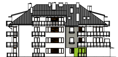
Elewacja tylna - wschodnia